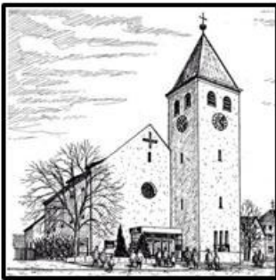
Herz Jesu - Kohlberg