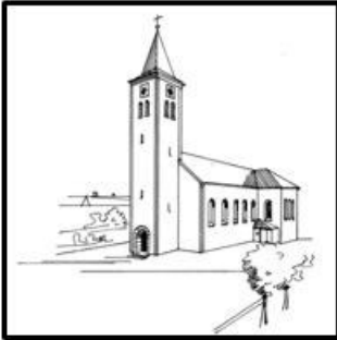
St. Martin – Kaltenbrunn